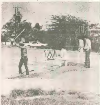
Tur cas ariba Aruba lo ser conecta ariba e ret nobo di telefon, e trabaonan ta avanzando.